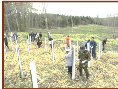
～後日新聞にも掲載されるようです。詳細が分かりましたらお知らせします～