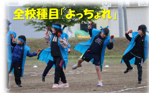
全校種目「よっちょれ」