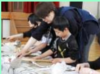
陶芸同好会による陶芸教室