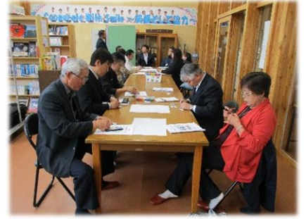
付箋に自分の考えを記入していきます