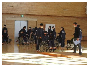
車いすについてのレクチャーをうけ、段差を体験中。

11月15日(火)に3年生で福祉体験学習を行いました。この学習では、毎年「標茶町社会福祉協議会」、「標茶町手話の会」のご協力をいただき「車椅子体験・高齢者擬似体験・手話講座」を実施しています。この体験学習を通して、福祉に対する興味関心を高めるとともに、ハンディキャップのある人の目線に立って、誰もが暮らしやすい社会について考える機会になりました。