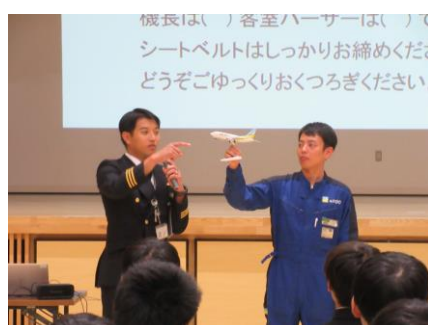
模型を使いながら、翼の周りの空気の流れについての説明をしてもらいました。

生徒のキャリア形成にかかわり貴重な機会を提供していただいたAIRDOの関係者の皆様方に、深く感謝申し上げます。