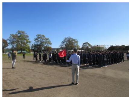
避難を終え、グラウンドに整列した写真になります。避難指示の放送を終えてから、1分6秒ほどで、避難を完了することができました。

避難にあたっては、様々なトラブルを予想しながら行いましたが、生徒は放送の指示に従いながら、整然と避難を終えることができました。標茶町のHPには「標茶町防災ハンドブック」などの防災情報が掲載されています。ご家庭内におかれましても、防災についての情報共有をお願い致します。