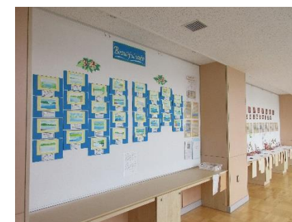
展示風景です。下描きをしないで、いきなりアクリル絵の具で着色しています（一発勝負！）

合わせて、釧路芸術館の所蔵作品を紹介する鑑賞教材も展示しています。お時間があれば、こちらも合わせてご覧ください。