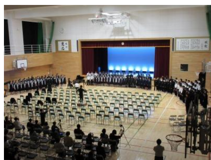
全校合唱も復活し、観客を包み込むような歌を目指し、練習してきました。

ご多用の中ご来校いただき、生徒の発表の様子を温かく見守っていただいた皆様方に感謝申し上げます。